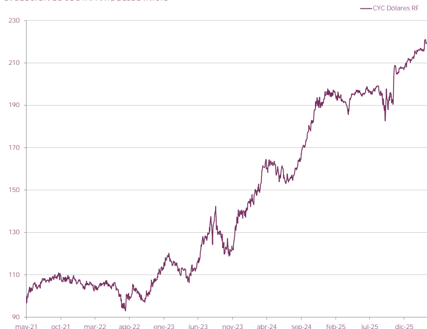
EVOLUCIÓN DE CUOTAPARTE DESDE INICIO